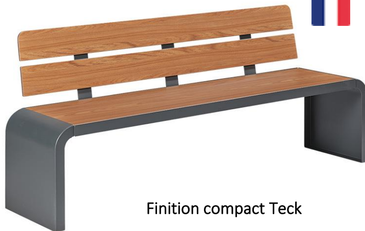
Finition compact Teck