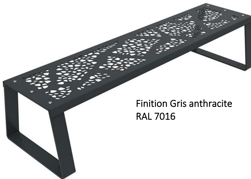
Finition Gris anthracite RAL 7016