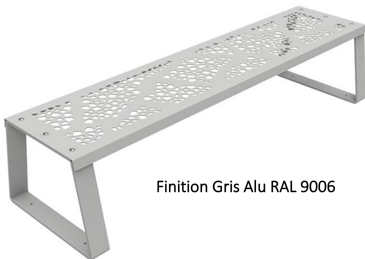
Finition Gris Alu RAL 9006