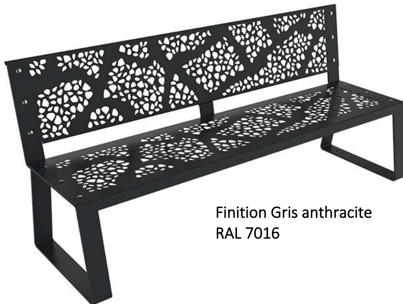
Finition Gris anthracite RAL 7016