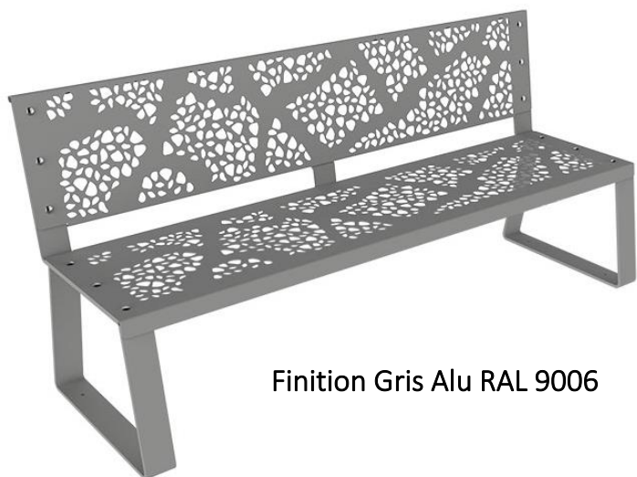
Finition Gris Alu RAL 9006