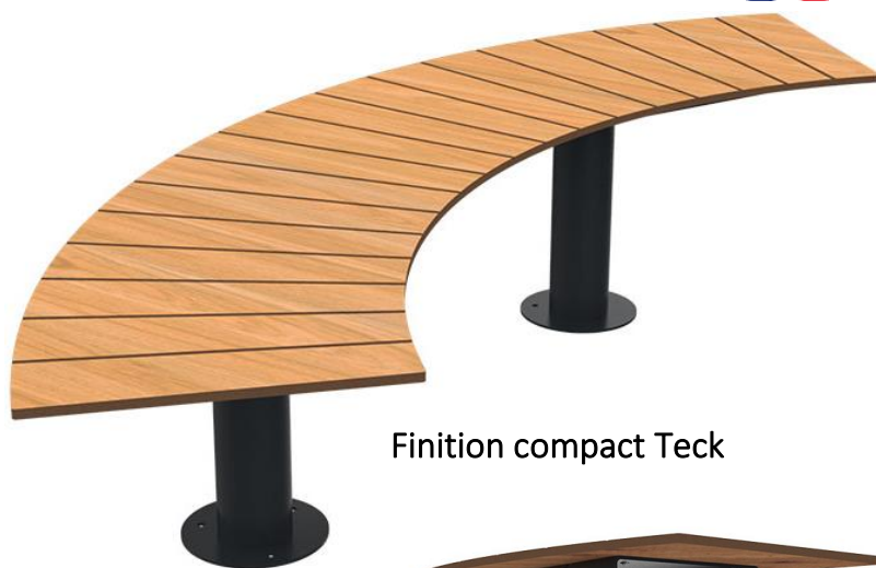
Finition compact Teck