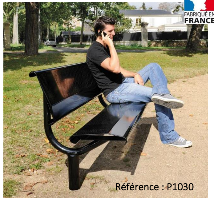
Référence : P1030