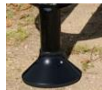
Embase décorative P1033