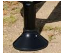
Embase décorative P1033